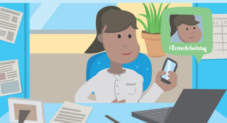
Abbildung: Szene aus dem Informationsclip

Alle Materialien und Teilnahmebestätigungen kostenlos bestellen unter: www.medienfuehrerschein.bayern