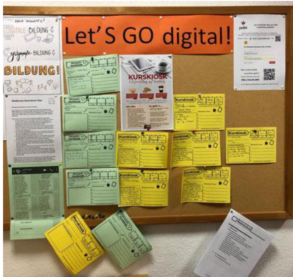
Abbildung 5: https://kurzelinks.de/Go-digital

KURSKIOSK hat sich bewährt, Fortführung auch per Videokonferenz: